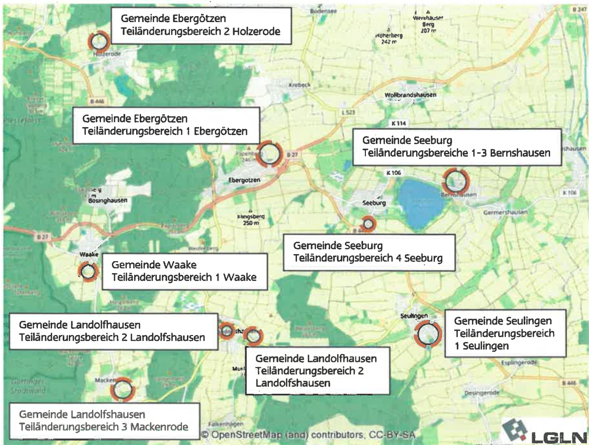
Übersichtskarte, Lage der FNP-Änderungsbereiche im Samtgemeindegebiet, ohne Maßstab, genordet